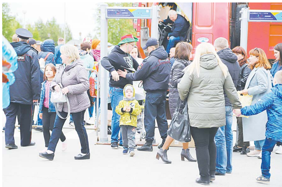
Калитки металлоискателей – штука полезная, но придуманы они были не для использования на улицах, а для охраны объектов. На улице любой желающий может открыть стрельбу из-за пределов огороженной площадки или бросить гранату в толпу.