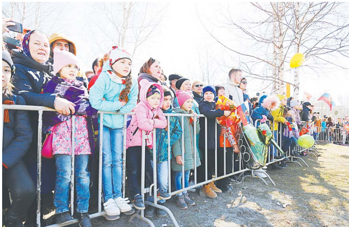
К заборам мы все привыкаем с детства. Уж чего чего, а этого добра в России всегда хватало.