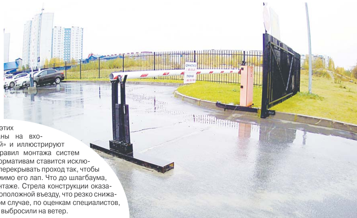
Оба этих снимка сделаны на входе в СК «Юбилейный» и иллюстрируют очевидные нарушения правил монтажа систем безопасности. Турникет по нормативам ставится исключительно в коридорах и должен перекрывать проход так, чтобы посетитель не мог протиснуться мимо его лап. Что до слагбаума, то его просто перевернули при монтаже. Стрела конструкции оказалась расположена на стороне противоположной въезду, что резко снижает защиту системы от тарана. В данном случае, по оценкам специалистов, примерно полмиллиона рублей просто выбросили на ветер.