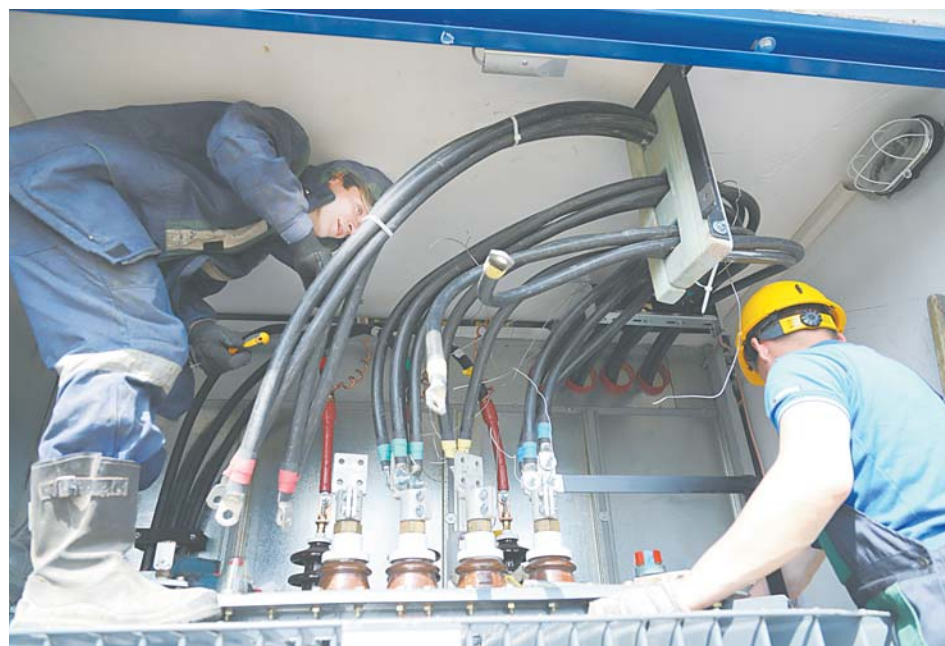
«Горэлектросеть» возводит блочные комплектные трансформаторные подстанции, которые приходят полностью готовыми с завода. В комплекте есть и здание, и «начинка» для него.