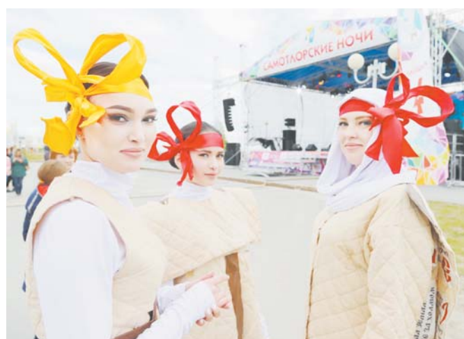
Каждый желающий мог ознакомиться с работами нижевартовских дизайнеров.