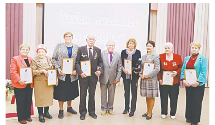
В центральной библиотеке им. М.К. Анисимковой прошла встреча с ветеранами-нефтяниками.