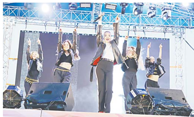
Хедлайнером закрытия фестиваля «Самотлорские ночи» выступила известная певица Юлианна Караулова.