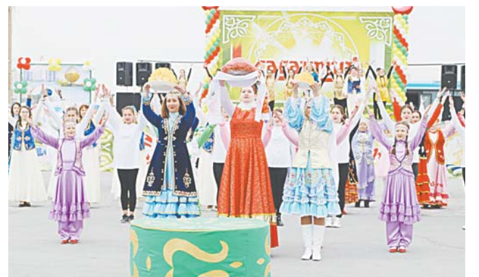
На национальный праздник хлеборобов пригласили делегации из Татарстана, Башкортостана.