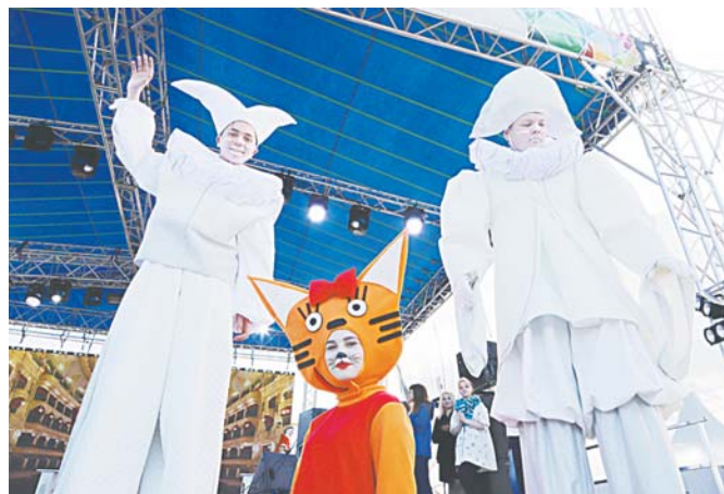
На протяжении всего фестиваля работала театральная площадка «Небесные кулисы».