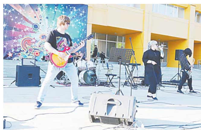
Возле ДК «Октябрь» прогремел рок-концерт местных групп «Поход на Север».