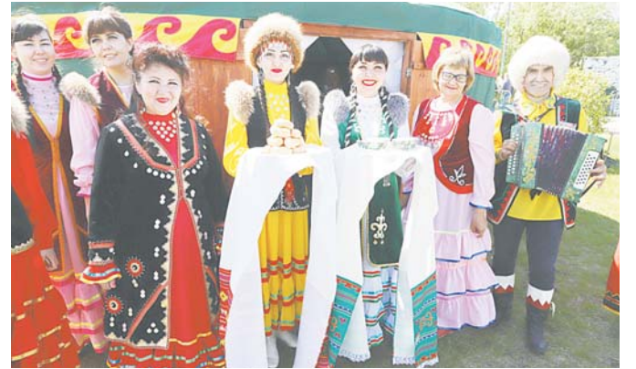
Татарско-башкирский праздник Сабантуй, как всегда, был очень красочным и веселым.

- Двойное чувство в последнее время у меня от фестиваля. Это ведь самый важный городской праздник. На открытии выступал мой внук, на которого мы всей семьей пришли посмотреть. Но какое же может быть торжество в такую погоду? «Самотлорские ночи», безусловно, развиваются, и я отмечаю, что власти приносят в него каждый год что-то новое... Но многое из этих новшеств просто смазано из-за холода и дожливости. И не надо пенять на природу. Изначально эти торжества проходили в самые длинные световые дни – в 20-х числах июня, когда северное лето полностью входило в свои права. Не знаю, кому и зачем понадобилось переносить фестиваль на пору, когда цветет черемуха. А ведь это всем известное время похолоданий. Считаю, что нам нужно обязательно пересмотреть эту практику и вернуть «Самотлорским ночам» их законное историческое место в календаре.