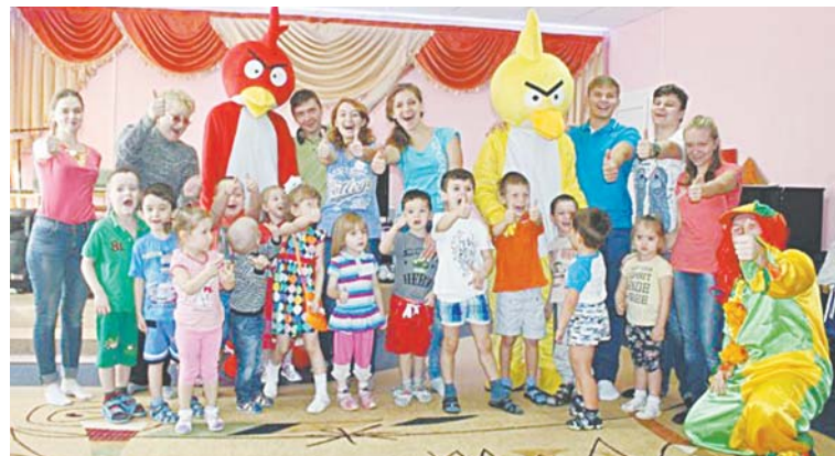
Отдельное направление работы волонтеров – особенные дети.