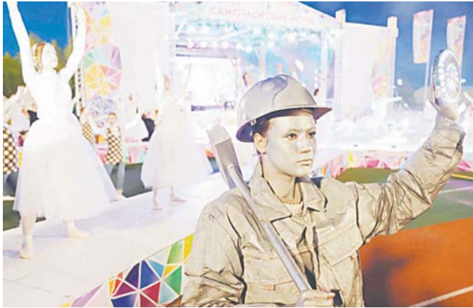
Открытие 44 фестиваля искусств, труда и спорта было ярким и запоминающимся.