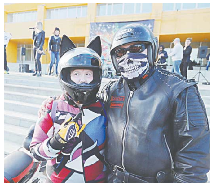
Посмотреть рок-концерт «Поход на Север» приехали зрители из близлежащих городов: Стрежевого, Радужного, Мегиона...