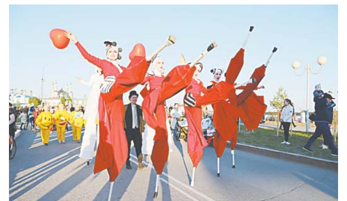
Ходулисты на площадке «Небесные кулисы» удивляли горожан и радовали зрителей.