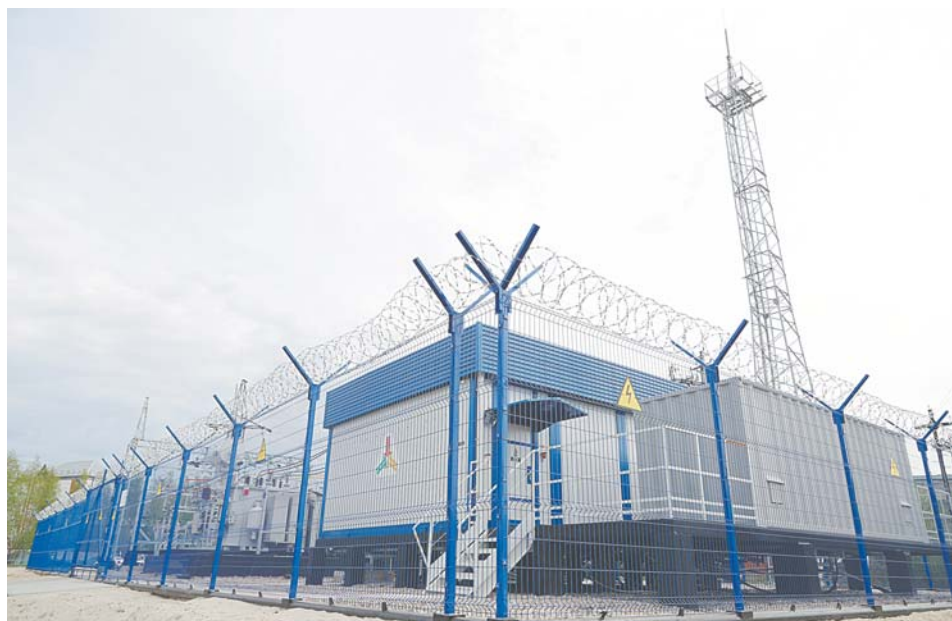
Высоковольтная подстанция «Энергонефть».