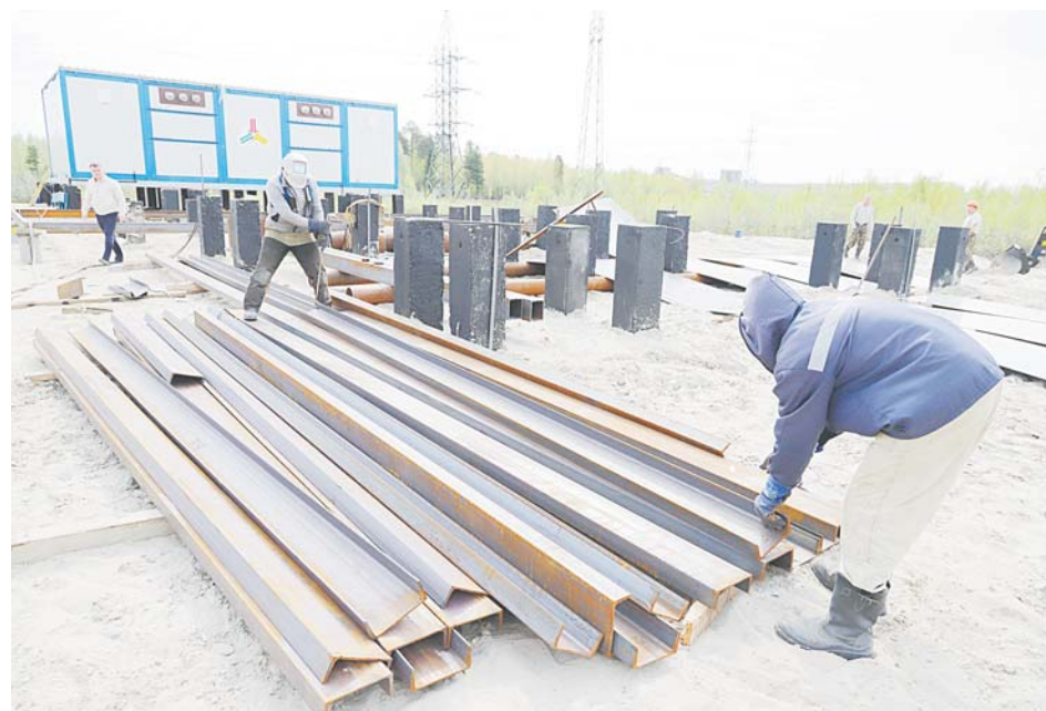
...а рядом уже возводится новый объект.