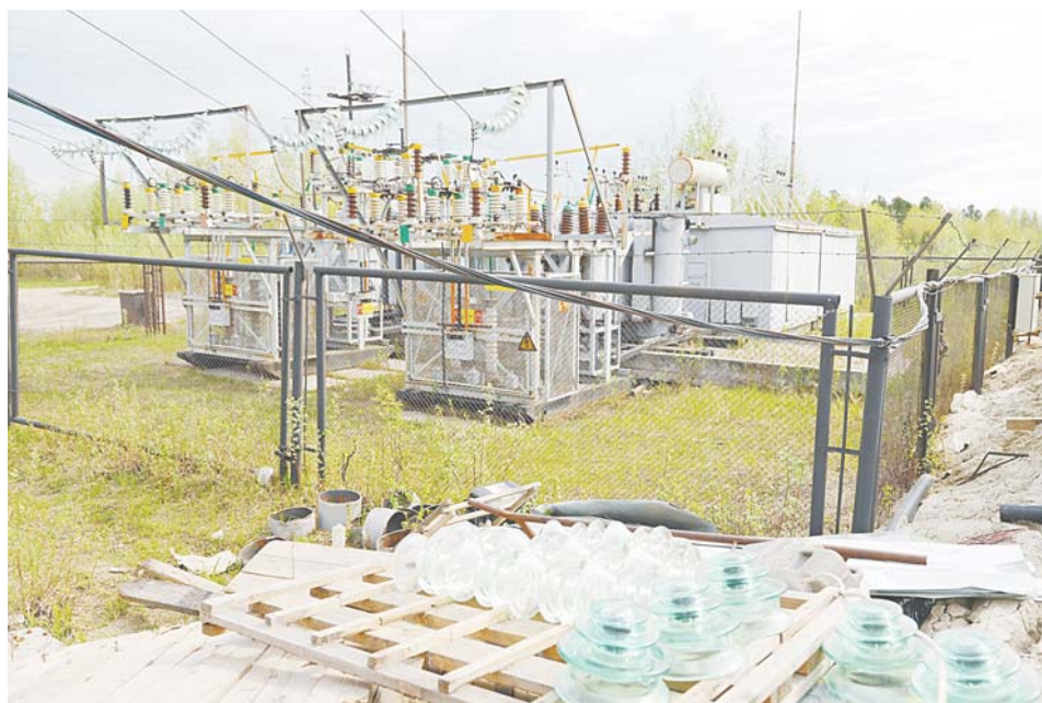
Старая ПС «Татра» еще питает окрестные предприятия...