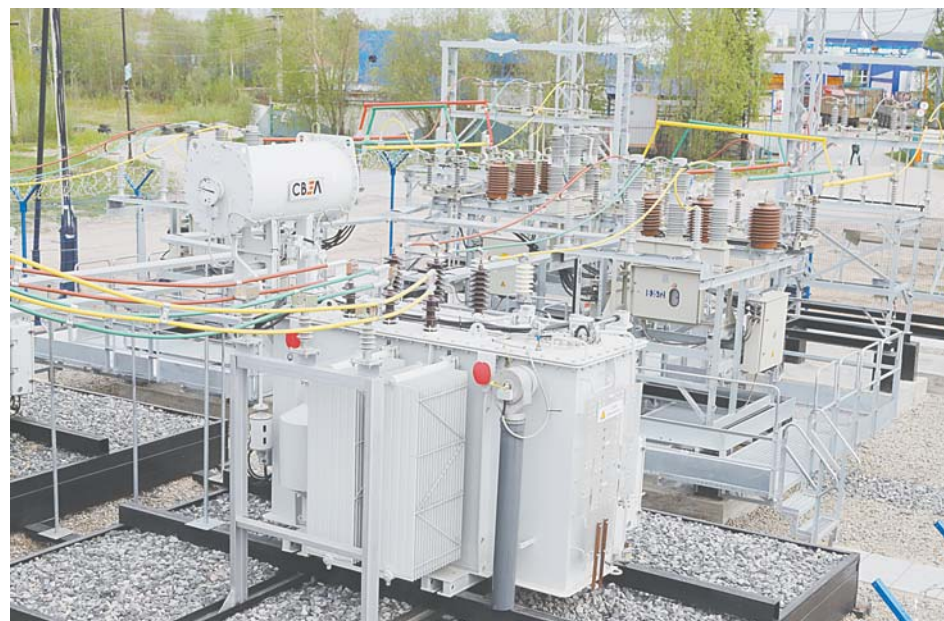
Новое силовое оборудование ПС «Энергонефть».