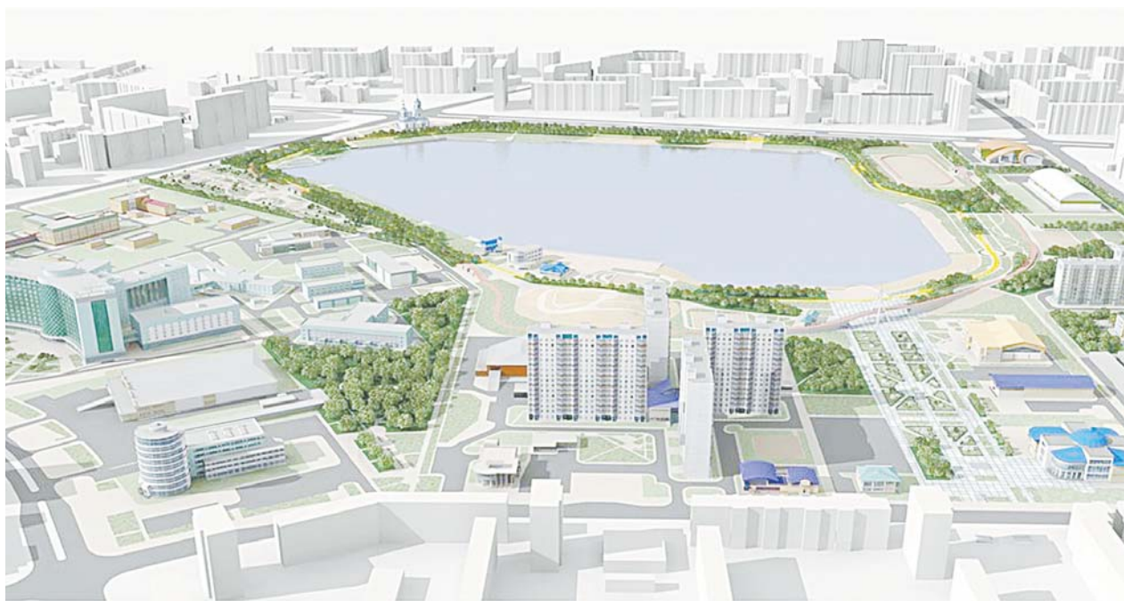
Концепция пространственного развития нашего города как центра Нижневартовской агломерации, пожалуй, ближе для понимания, чем футуристические изменения пока еще умозрительной межмуниципальной конструкции.

Мы посвятили этой теме уже две полноценных публикации и та, что вы сейчас читаете, вероятно, не станет последней. В ней мы попытаемся ответить на вопрос: что роднит любимый и вполне осязаемый Нижневартовск с мифическим городом Нью-Васюки, который придумал экспромтом известный литературный персонаж Остап Бендер.