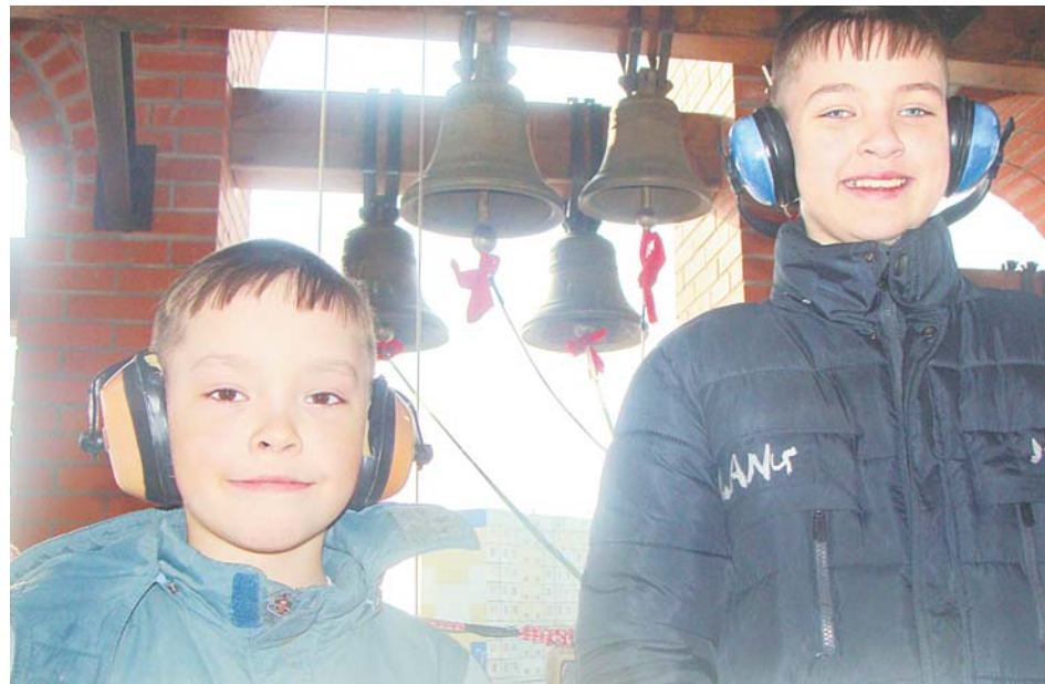
Вот оно счастье – быть дома, в родном Нижневартковске.