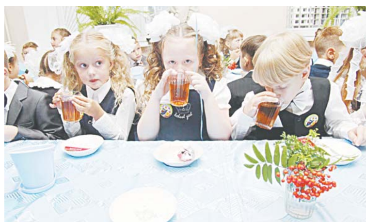
В меню школьников Нижневарттовска повара добавляют специальные полезные элементы и витамины. Например, в компоты и морсы добавляют аскорбиновую кислоту.