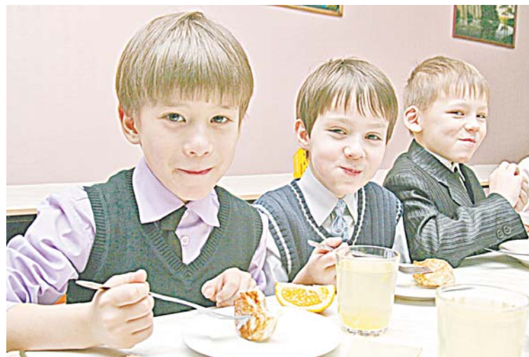
Масштабные проверки представителей Общественной палаты города по школьным столовым показали высокий уровень питания нижеварттовских учеников. Смотрели на все: от внешнего вида столовой до исправности сантехники в пищеблоке и маркировки продуктов.

НИ КОПЕЙКИ ДОПОЛНИТЕЛЬНО С ВАРТОВЧАН НИКТО НЕ СПРОСИТ!