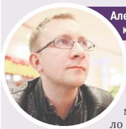
Алексей ЛБОВ, корреспондент

Кто скажет, что Россия не меняется со временем, тому смело плюньте в лицо. Он просто газет не читает. Иначе знал бы, что у нас даже язык формируется какой-то новый. Незнакомый доселе. Всевозможные хайпы, батлы, коучи, хейтеры, тайм-кафе и хронофаги с транквилами потихоньку изживают привычные русские слова. Чего стоят хотя бы панкейки, которые продают в кофейнях вместо устаревших кексов. Под модные словечки, вероятно, проще подтягивать ценник.