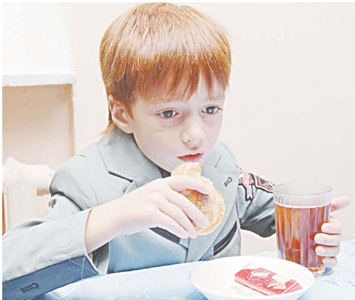
Чиновники заверяют: перемена источника финансирования никак не отразится на качестве школьного питания. В настоящее время в бюджете города зарезервирован 181 миллион рублей на обеспечение такой формы поддержки.