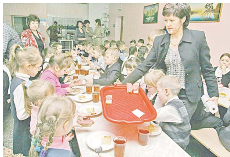
Цикличное меню, по которому питаются школьники, утверждает Роспотребнадзор. Это не значит, что дети и родители не имеют права голоса. Их мнение также учитывается при выборе блюд.