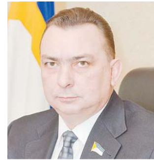
Председатель Думы города Нижневартовска Максим КЛЕЦ