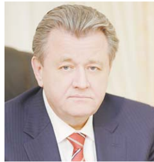
Глава города Нижневартовска Василий ТИХОНОВ