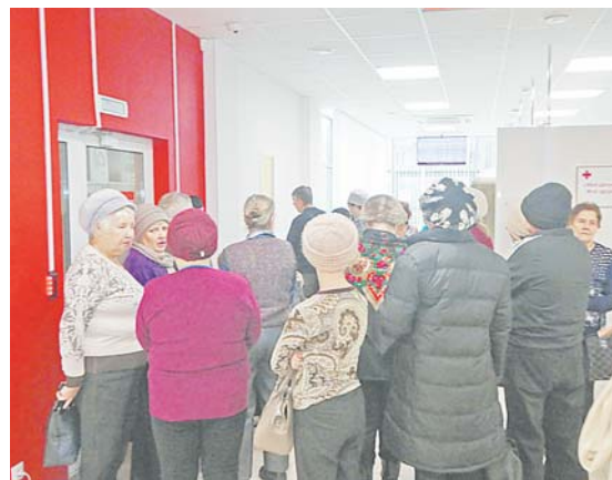
Происходящее в кабинете напоминает конвейер: одному посетителю меряют давление, у второго - проверяют работу легких, а третий уже слушает консультацию врача. Очередь движется быстро.

правлению. При обнаружении подобного сбоя в работе организма, мы даем ряд рекомендаций. Например, при высоком артериальном давлении - по гипотензивной терапии.