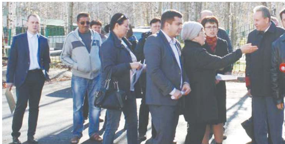
Выездные заседания Думы Нижневартовска – это часть постоянной депутатской работы.

Депутаты также утвердили правила землепользования и застройки на территории города, внесли изменения в Устав Нижневартовска и одобрили кандидатуры вартовчан, которые будут награждены Почетными грамотами думы города и знаком «Родительская слава». очередное заседание думы состоится в ноябре.