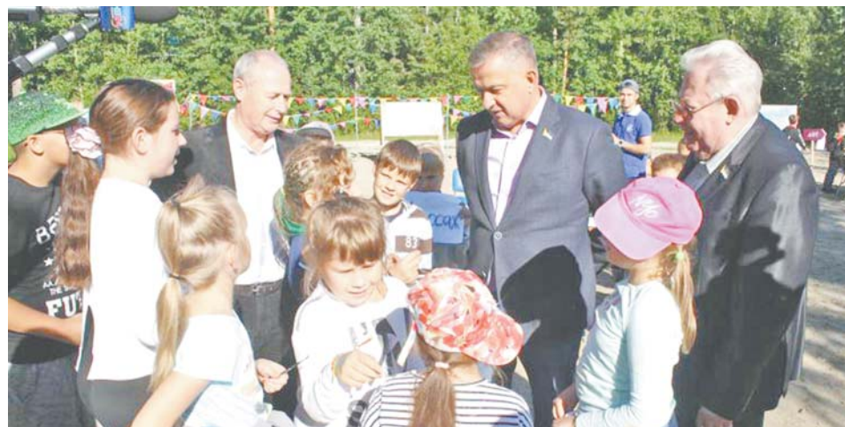
Во время летних каникул депутаты много раз лично приезжали в спортивно-оздоровительный комплекс «Радуга».