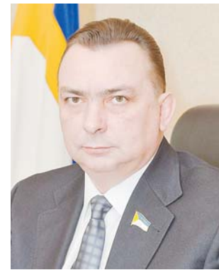
Председатель Думы города Нижневартовска Максим КЛЕЦ

Уважаемые автомобилисты! От всей души желаем вам стабильной, безаварийной работы, удачи на жизненном пути, крепкого здоровья, счастья и благополучия!