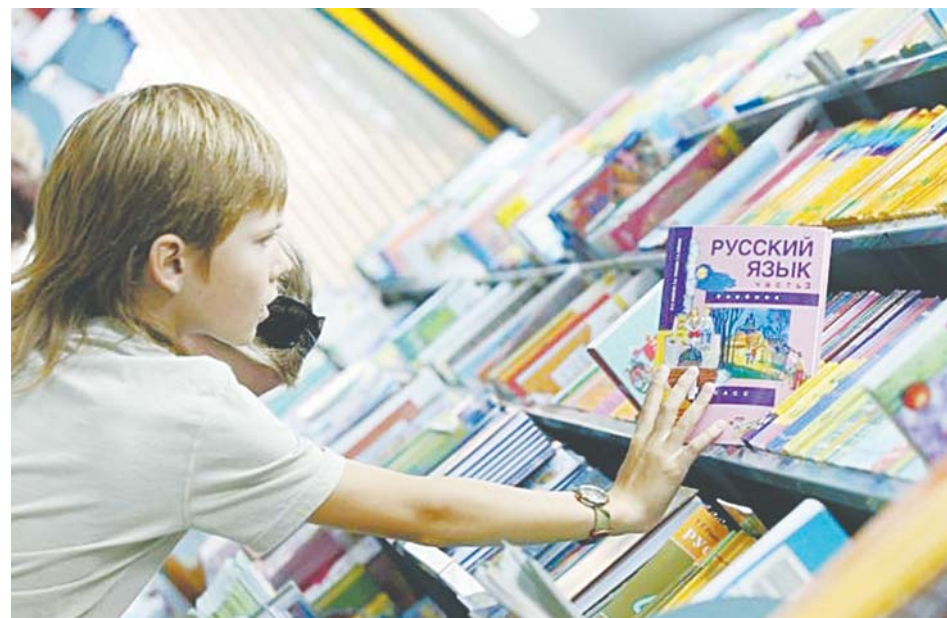
Все необходимые для учебы пособия и тетради закуплены центром образования.

дителям вообще запрещено самим покупать рабочие тетради по своему желанию. У всех учебные планы разные, и где-то тетрадь требуется, а где-то - нет. Если для обеспечения федерального государственного стандарта образования решено, что рабочая тетрадь нужна, она приобретается и вводится как необходимая норма учебного процесса. Но если покупка рабочей тетради это незапланированная самостоятельность учителя (да еще и за счет родителей), то в нижневартовской системе образования такие инициативы строго наказуемы. У нас выявлены два подобных случая, и виновные подвергнуты дисциплинарным наказаниям. Если учитель требует купить родителей такую тетрадь, об-