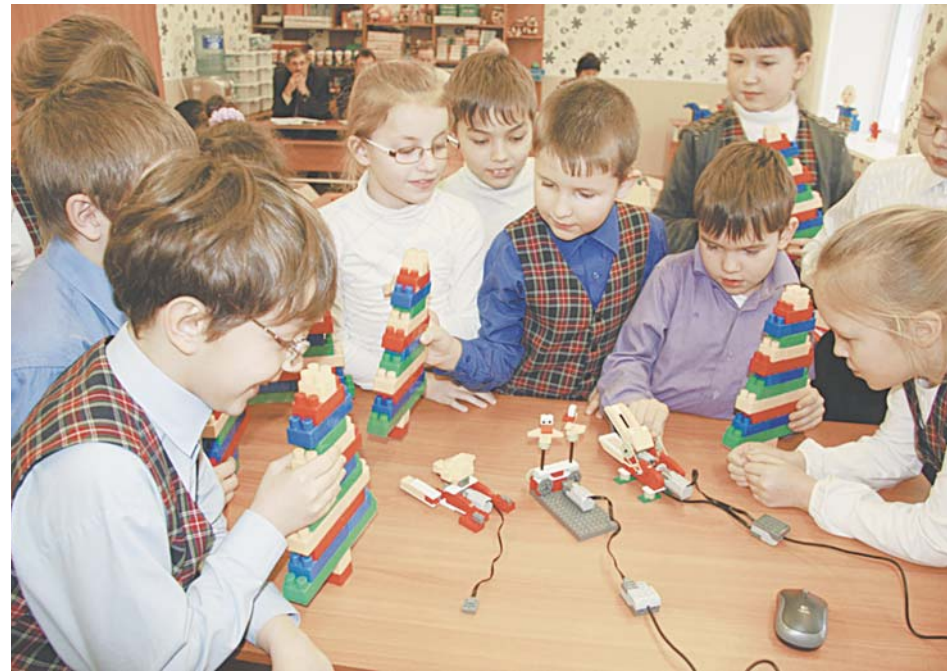
Школа полного дня предполагает и дополнительное образование. Предпочтение отдают техническим навыкам.