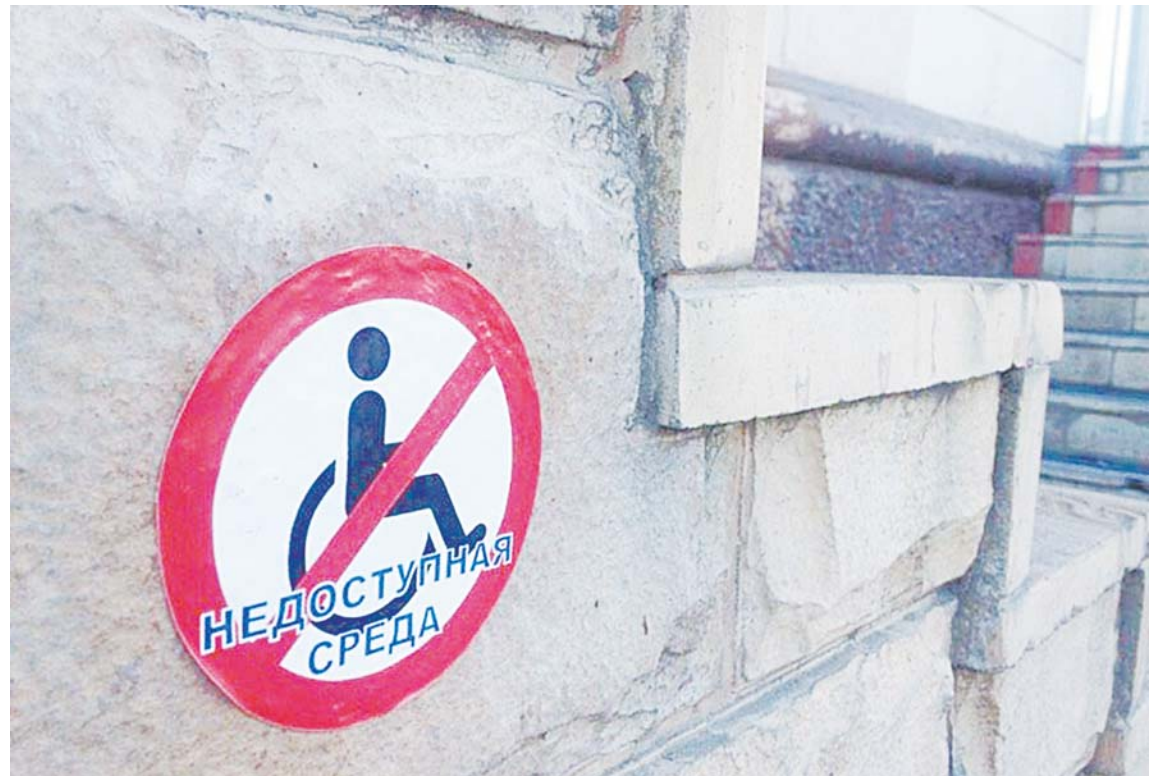
В крупных городах России в прошлом году появились сотни таких наклеек. Ими инвалиды самостоятельно помечают места и учреждения, где для них нет нормального доступа, нет условий. Возможно, что пора и нашим землякам взять этот опыт на вооружение.