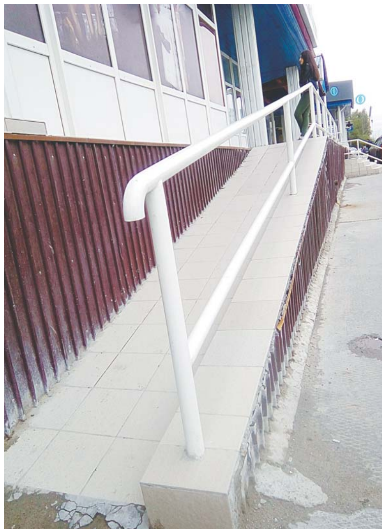
Вот такой пандус есть у одного из банков Нижневартовска. Формально он существует, но подняться по нему может только человек в добром здравии. И таких мест по городу десятки.

На этом, пожалуй, стоит поставить точку. Многим может показаться, что наш текст мрачен и не отражает многих светлых сторон в современной жизни инвалидов. Да, это так, но и большинства темных он не отражает тоже. Мы лишь чуть-чуть коснулись очень тяжелой темы и намерены к ней вернуться в более развернутом материале. В том числе и с вашей помощью. А потому пишите и звоните нам, не стесняйтесь. Делитесь мнением на этот счет. А в декабре, прямо перед празднованием Дня инвалидов, мы вновь об этом поговорим.