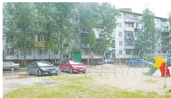
На Комсомольском бульваре, 14а уже положили тротуар, а впереди – обустройство проезда, парковки и детской площадки.

Однако жители указанного дома посчитали эти траты избыточными. При этом никакой серьезной реконструкции не проводилось в микрорайоне ни разу с момента его возведения (более 40 лет). Так что табличке «Дом образцового содержания», которая некогда красовалась на здании первой девятиэтажки Нижневартовска, видимо, еще долго висеть здесь не придется. Никто никого неволить не будет. Впереди еще много работы там, где этого хотят сами люди.