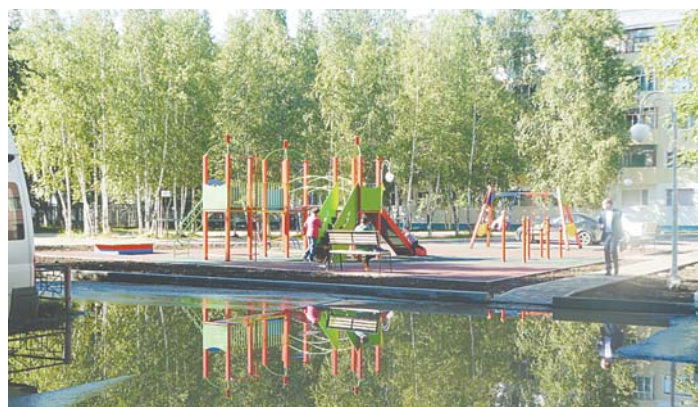
После ремонта проезда на ул. Омской, 18, детская площадка будет отражаться в поверхности нового асфальта.