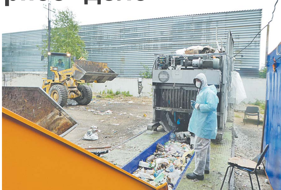
Привезенные из микрорайонов отходы сразу же попадают на конвейерную ленту мусоросортировки.