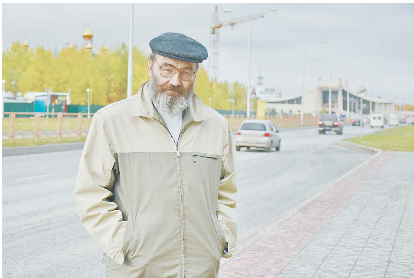
Улица Чапаева – это выстрадавшее «дитя» нашего героя.