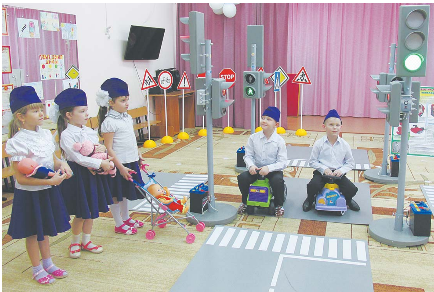
В детских садах и школах Нижневартовска уроки Правил дорожного движения уже давно стали частью учебного процесса.