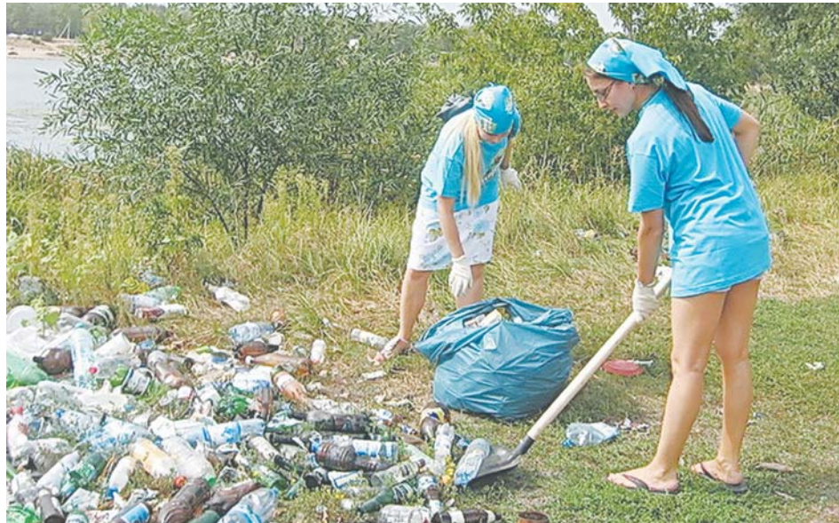
Отдыхать вартовчане любят, а вот убирать за собой готовы не все. Именно поэтому в местах массового отдыха год за годом образуются свалки.

Официального общественного пляжа в Нижневартовске пока нет. А летняя жара продолжает гнать горожан поближе к водоемам. Базы отдыха решают проблему лишь частично. У кого-то нет личного транспорта, кто-то в выходные не хочет садиться за руль... И, как итог, люди идут отдыхать на Комсомольское озеро. Но безопасен ли этот водоем? Сегодня мы ответим на этот вопрос, а также посмотрим на перспективы обрести экологически чистое место для отдыха на воде.