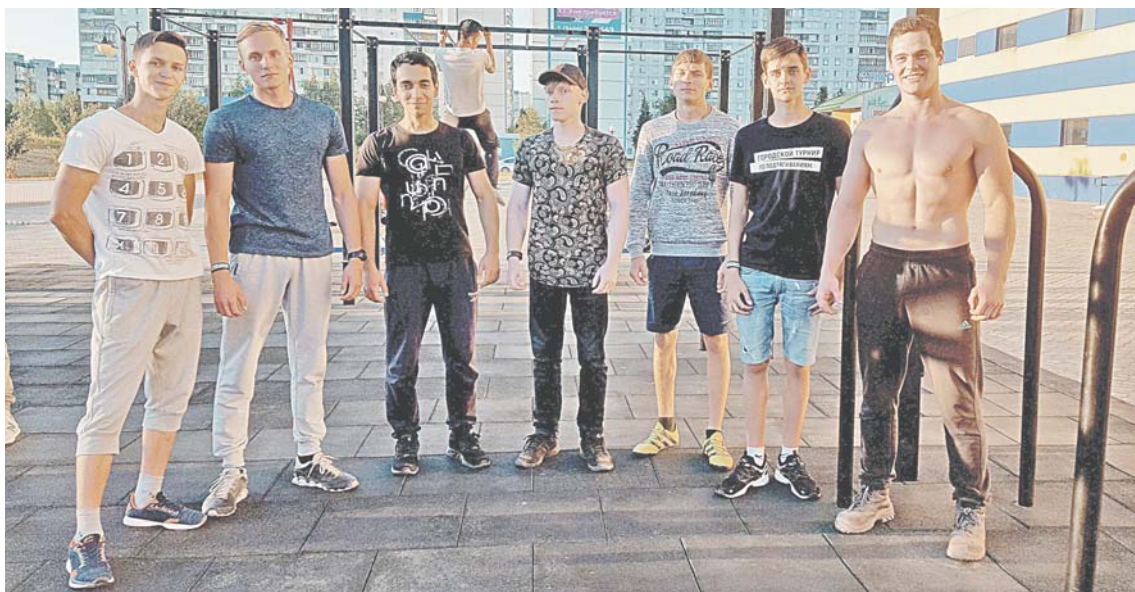
Спортсмены из нижневартковского work-out клуба – «Простые парни». Они вдохновляют на занятия спортом сотни юношей.

Да каких спортсменов, заметим! У нас одних только олимпийских призеров вкпе с чемпионками мира больше трех десятков, а разрядников и обладателей мастерского звания – многие сотни. В Нижневартковске есть мощная база для спорта высоких достижений, но как живет в городе тем, кто не желает этих высот, а просто хочет поддерживать себя в форме и слегка размяться вблизи от дома? Мы провели собственный мониторинг городского уличного спорта и готовы заключить: он в наших краях живет и здравствует.