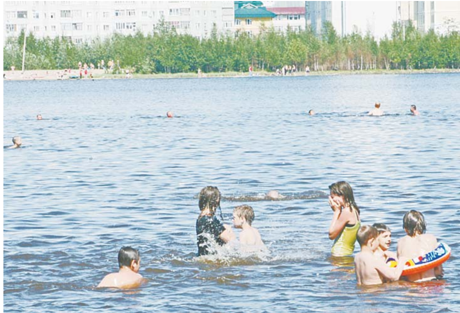
Основные купальщики на Комсомольском озере – это дети, для которых вопрос экологической безопасности даже не стоит.

Мы должны вести пропаганду среди подрастающего поколения, объясняя, что экология – это вполне реальная часть нашей жизни. Кроме того что в городе отлично работают коммунальные службы, нужно и самим вартовчанам более ответственно относиться к окружающей среде. Мне больно видеть, сколько мусора наши земляки оставляют на Кымыл-Эмторе и на Комсомольском озере. Так что даже если в городе и появится официальный пляж, мы проблему экологи-