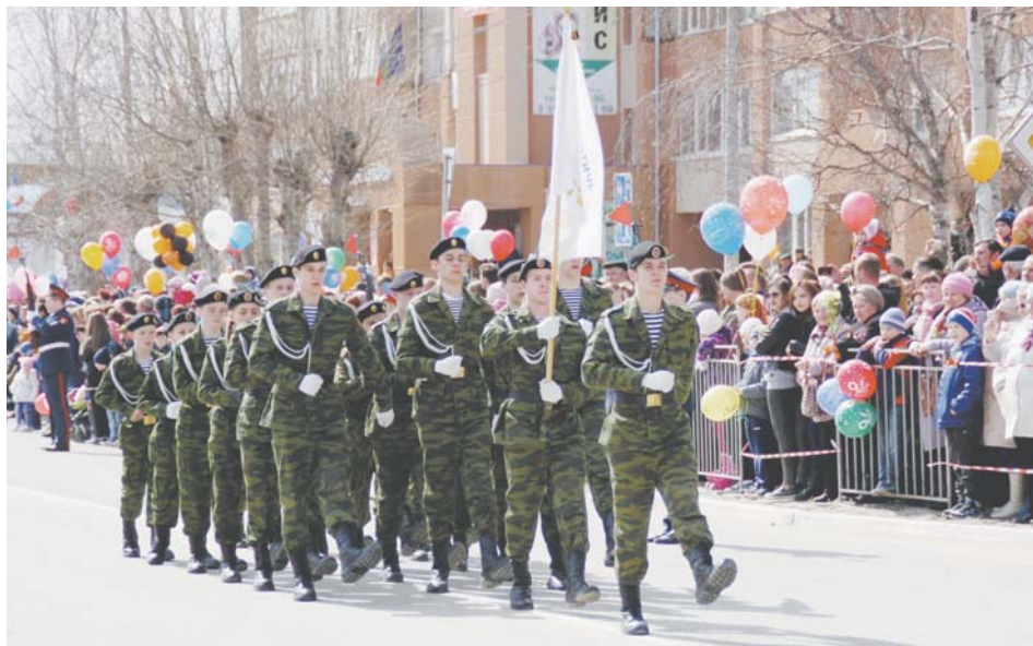
Павел Колин Фото из архива Сергея Миронова

Сергей Миронов политикой не интересуется. Хотя, конечно, и за справедливую Россию. А еще он за воспитание патриотизма. Приехав в Нижневартовск из Советска за образованием, парень поступил в НВГУ, где осваивает премудрости работы с молодежью. Собственно, он и сам еще вчера был мальчишкой, с которым занимались этой работой, Сергей – воспитанник военно-патриотического клуба в родном городе.