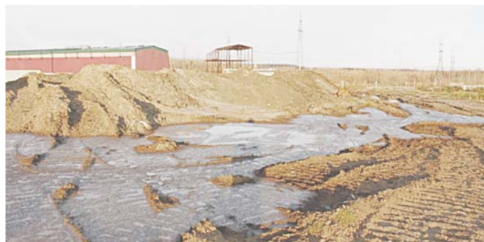
Терриконы бурового шлама неподалеку от водозабора Нижневартовска.