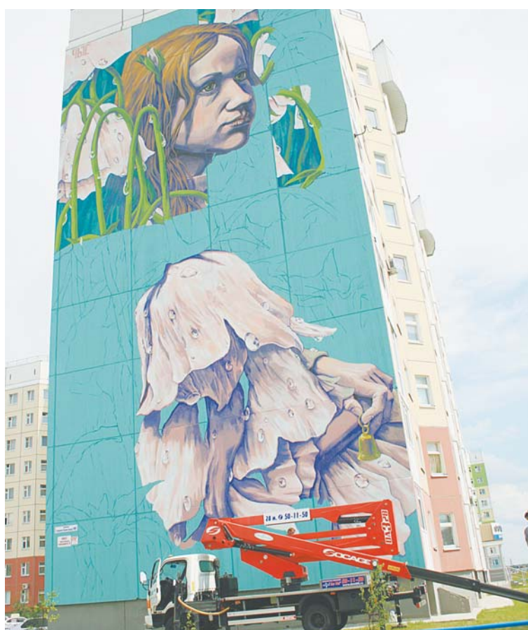
ул. Героев Самотлора, 19. Автор: Рустам Салемгареев. Рабочее название: «Молчаливый разговор». Готовность работы – 60%. Это будет лиричная, чуть грустная картина о девочке, окруженной цветами колокольчика и с металлическим колокольчиком в руках. По замыслу автора, она отражает единение человека с природой и с самим собой. Без лишних слов и показной экспрессии.