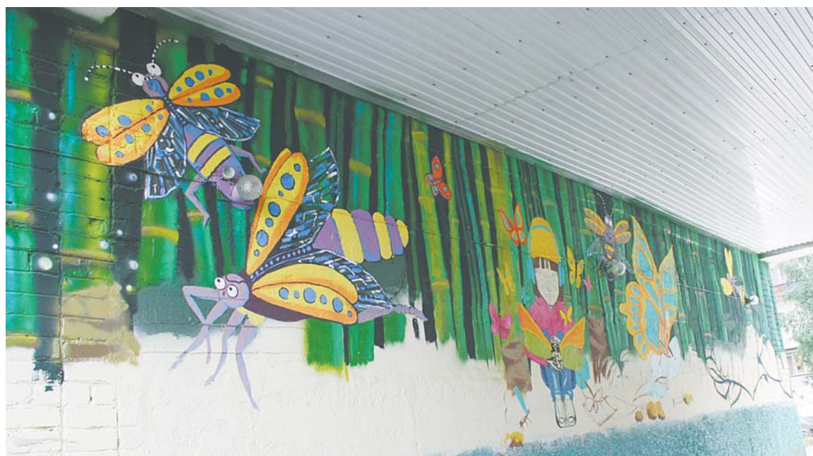
ул. Дружбы народов 28, арка. Автор: Любовь Молева. Рабочее название: «Творец». Готовность произведения: 80%. По замыслу автора, картина должна согреть вартовчан хорошим настроением даже в сильные морозы, и эта мысль стала ключевой при выборе эскиза и палитры. В центре произведения девочка – смысленная, любознательная и открытая миру, а окружают ее бабочки и светлячки.