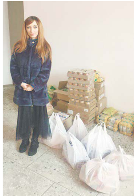
В «авоськах» собранные всем миром продукты для ветеранов.

Сегодня многие хотят помочь ближним. Только, порой, нам проще отправить деньги на непроверенные счета в помощь непонятно откуда взявшимся людям, чем пойти и помочь конкретным детям или старикам. А такая возможность есть. И труды наши, и деньги при этом точно не пропадут даром. Достаточно обратиться в благотворительный фонд «Твори добро» и выбрать себе проект по душе. Уже год эта благотворительная площадка ведет работу, чтобы объединить как можно больше вартовчан для поддержки нуждающихся земляков.