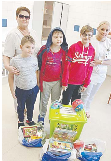
Прошел процедуры? Получи подарок «за отвагу».