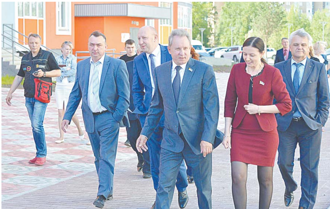
Для нижневартовских депутатов лето – жаркая пора. Много выездной работы.

Одним из самых интересных могло стать обсуждение