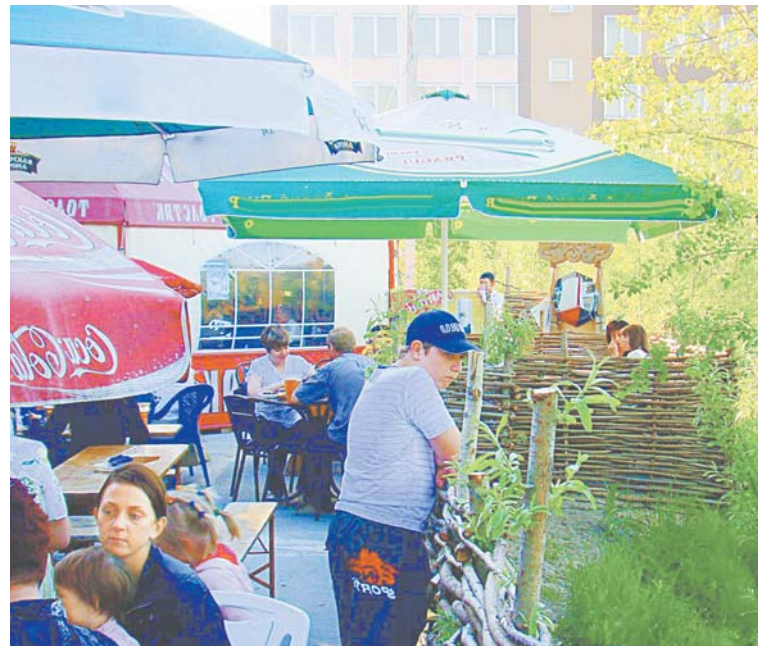
Летних кафе в Нижневартовске станет меньше. А занятий для молодежи, наоборот, прибавится.