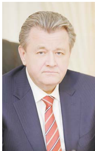
Глава города Низневартовска Василий ТИХОНОВ

От всей души поздравляем вас с Днем Победы – самым волнительным и значимым праздником для нашего народа.