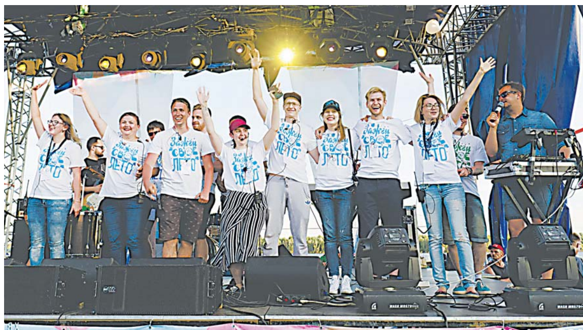
Будущее нашего города в руках молодежи: талантливой, умной, неравнодушной

Молодежь, порой, обвиняют в инертности и отсутствии четких жизненных принципов. Подобные слова нередко можно услышать от людей в возрасте. Мол, только и умеют, что по подъездам сидеть, играть на компьютере да делать селфи для соцсетей. Есть, конечно, и такие молодые люди в Нижневартовске, но гораздо больше ребят активных и умных, готовых меняться самостоятельно и менять к лучшему мир вокруг себя. В последние годы для того, чтобы поддержать и направить усилия юных вартовчан, появляется все больше инструментов и средств. И ключевое из них – социально ориентированные общественные организации, которых год от года становится больше в нашем городе.