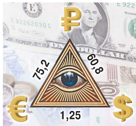
Курсы доллара и евро на день выхода номера.