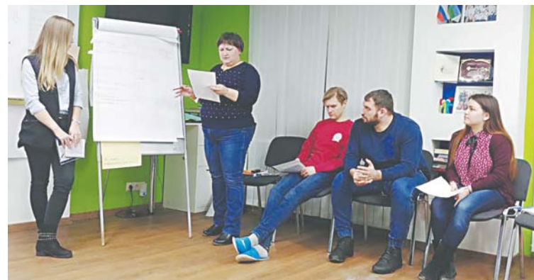
В Нижневартовске ежегодно проходит до десятка и более тренингов и семинаров для молодежи и не только. Быть активистом, волонтером, руководителем НКО непросто. Этому нужно учиться!

Судите сами: в штате даже маленькой российской компании, как правило, есть собственный бухгалтер, который постоянно контролирует