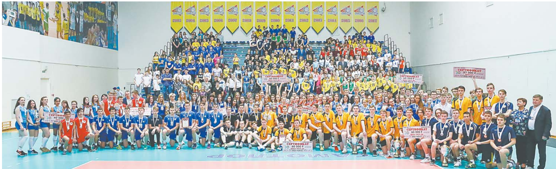
Общий снимок победителей конкурса и их тренеров (более 200 человек). Пятый сезон был самым массовым в истории ШВЛ.