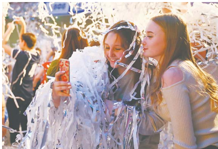
Какой же праздник без хорошего селфи? Лучшие мгновения жизни можно хранить не только в собственной памяти, но и в социальных сетях...