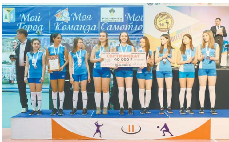
Все призеры ШВЛ получили не только медали, но и денежные призы для своих школ. Общая сумма выплат – около 600 тысяч рублей.