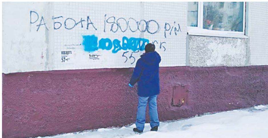
Подобных надписей на стенах Нижневартовска немало. Их регулярно закрашивают общественники, но следом появляются новые. А текст таких объявлений – это вранье от слова до слова. Правильно писать не работа, а «преступление», а вместо выдуманных «180 тысяч» – указывать сроки тюремного заключения. Среднестатистически по ст. 228 УК РФ дают пять-семь лет, а если выявлена преступная группа (более одного человека), то там уже накручивают по 10 и более.

«Почему столько внимания именно «художникам?», – спросите вы. Да очень просто. В случае с наркотиками не только спрос формирует предложение, но и наоборот. То есть пока будет реклама и агрессивный маркетинг со стороны наркобарыг, найдутся и те, кто станет покупать у них зелье. Кроме того, через над-