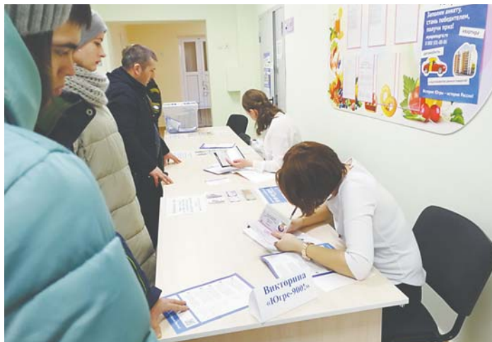
Одним из примеров корректной работы, лишь косвенно мобилизующей избирателей, стала организация историко-просветительской викторины «Югре-900», итоги которой подведут 24 марта.

Как отмечают эксперты, на рост активности голосующих, как правило, влияет множество факторов. В президентской кампании 2018 года, безусловно, сыграла свою роль внешнеполитическая обстановка, значение легитимности выбора россиянина в контексте последних событий на международной арене, другие аспекты общенациональной повестки. Но ключевым моментом в том, что явка избирателей в Югре на состоявшихся выборах президента оказалась