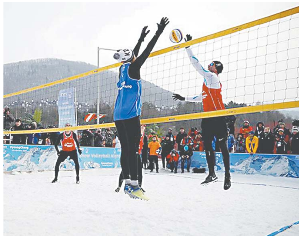
На Олимпийских играх презентовали новый зимний вид спорта.

Волейбол играют в зале, в волейбол играют на песке, а с недавних пор заиграли еще и на снегу. В сезоне-2015/16 волейбол на снегу был официально признан Европейской конфедерацией волейбола, был проведен первый в истории европейский тур. В марте 2018 года в Австрии пройдет первый чемпионат Европы по волейболу на снегу.