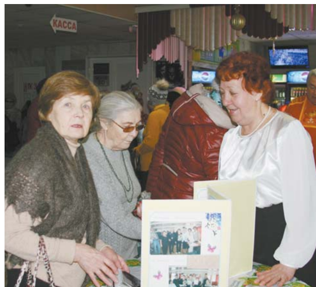
«А помните?», – часто спрашивают в клубе «Добрый вечер». Вместе им есть что вспомнить.