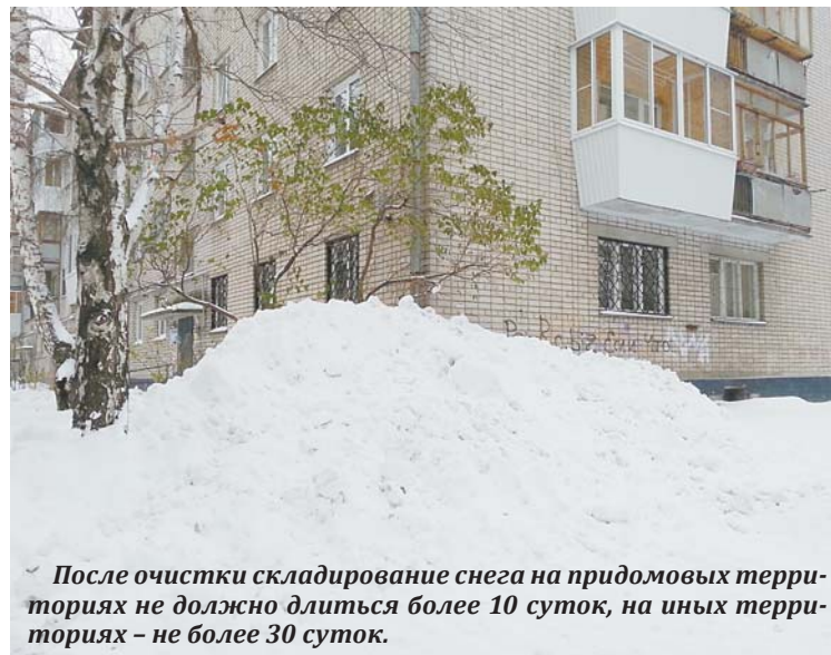
После очистки складирование снега на придомовых территориях не должно длиться более 10 суток, на иных территориях – не более 30 суток.

Еще одним традиционным природоохранным направлением работы в Нижневартовске стало выявление несанкционированных свалок на земельных участках. В 2017 г. было выявлено более 40 таких мест площадью более 4 га. На полигон вывезено более 1 800 кубометров твердых коммунальных отходов.