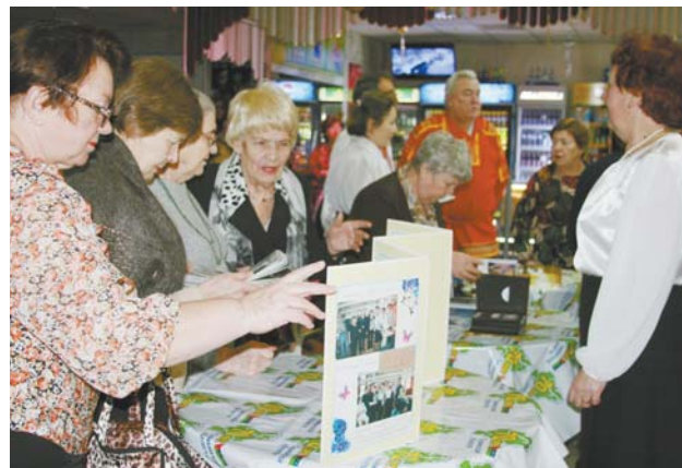
Жизнь клуба «Добрый вечер» находит отражение в альбомах и стенгазетах.