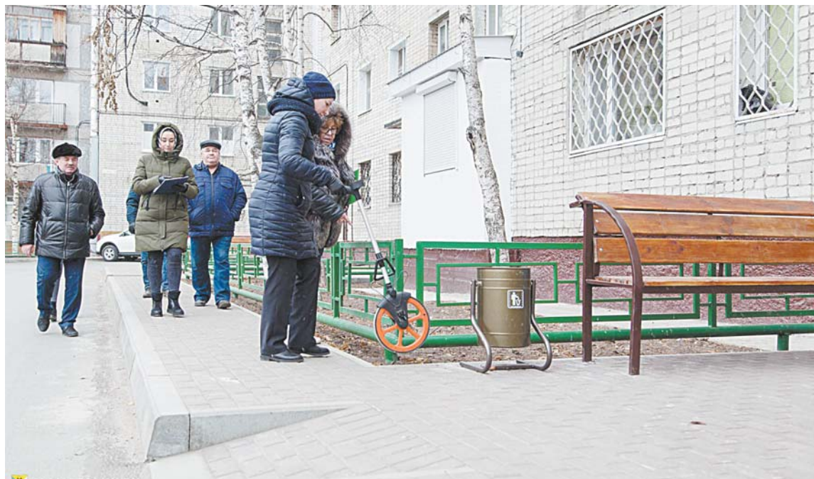
Приемка работ по благоустройству территории 5 микрорайона.

му будет происходить моментально. Но мы все вместе договорились, что нужно двигаться в этом направлении, переводить все на рыночные рельсы. Цель НРИЦ – сделать так, чтобы каждый потребитель четко понимал назначение каждого заплаченного им рубля и мог затем посмотреть его использование. Процесс создания расчетно-информационного центра непростой, есть целый комплекс юридических и технических вопросов, которые мы сейчас решаем. Эта работа четко попадает в вектор развития российского законодательства – сейчас в Правительстве РФ готовится законопроект о прямых расчетах с поставщиками услуг. Мы надеемся, что НРИЦ заработает в полном формате, открыв фронт-офис для потребителей услуг в начале 2018 года.