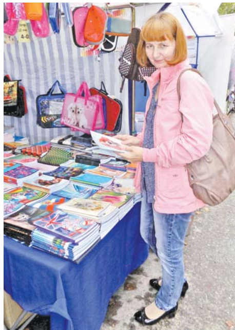
Чтобы собрать ребенка в школу, родителям пришлось изрядно потратиться. Причем сборы первоклашек и девочек обходятся дороже, чем сборы старшеклассников и мальчишек.