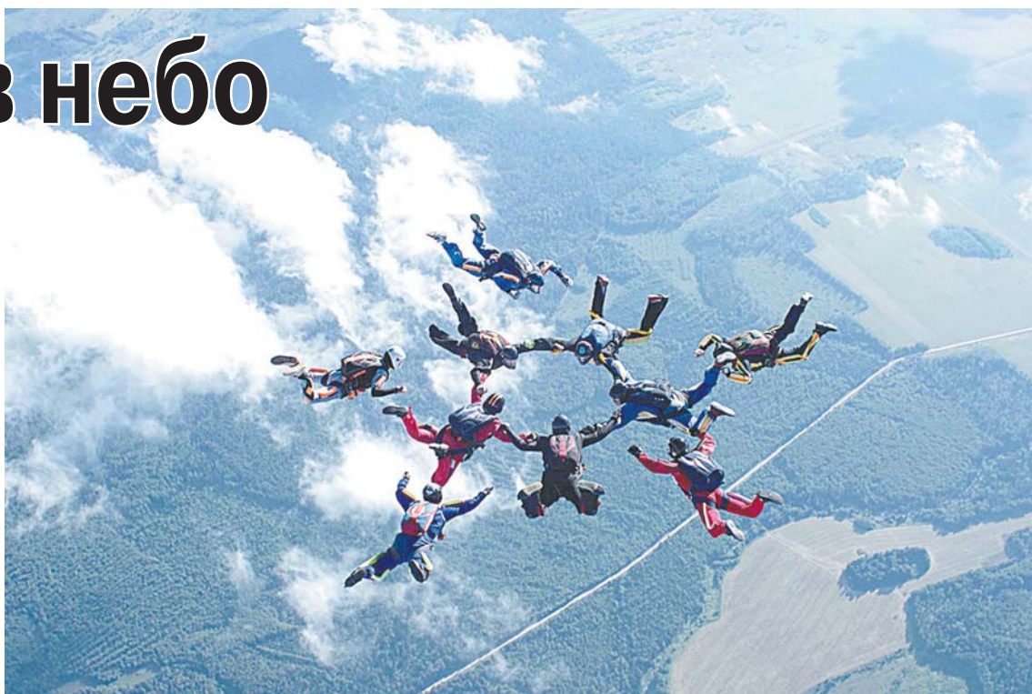
Всего несколько секунд в воздухе, держась за руки, и рекорд зафиксирован.