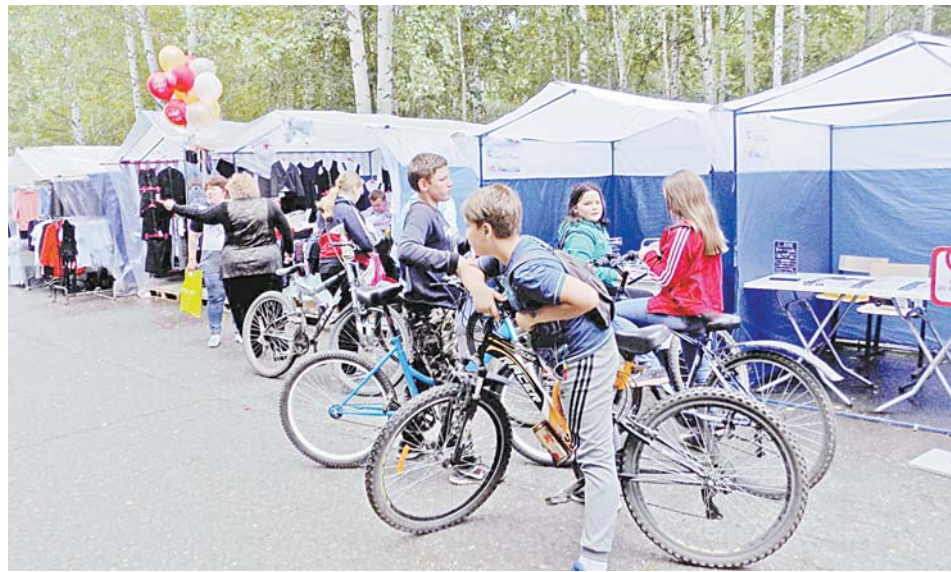
В последние дни летних каникул еще можно покататься на велосипедах. Скоро на двухколесного друга времени не будет.