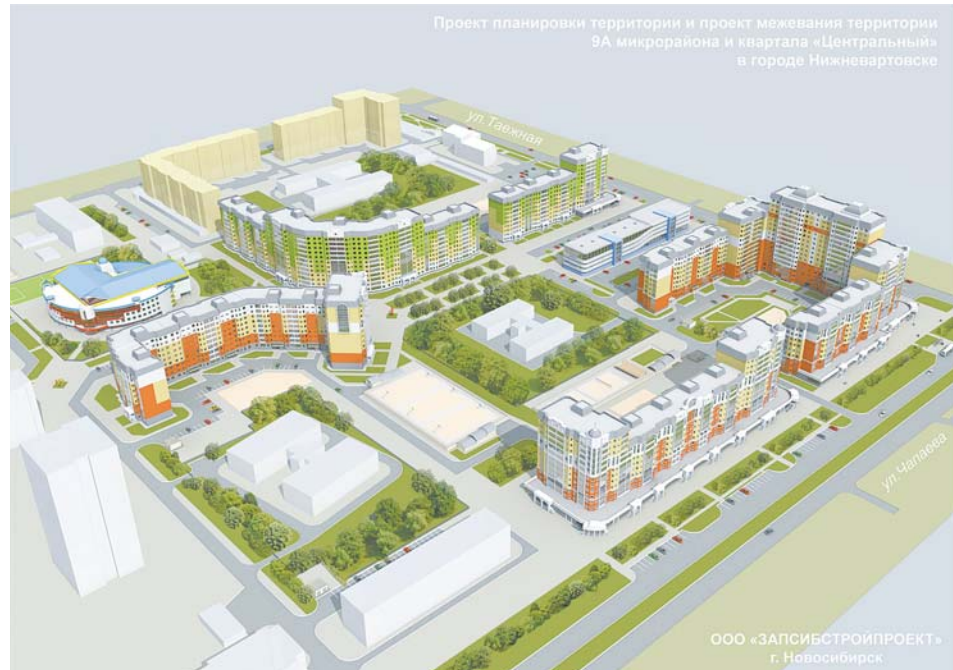
По плану 9А микрорайон должен выглядеть так.

Именно под такую школу на 1100 учащихся ООО «ТЕРПЛАНПРОЕКТ» (г. Омск), в рамках муниципального контракта, подписанного в июне этого года, и внесло изменения в проект планировки 9А микрорайона. Нормативный показатель для определения границ земельного участка под общеобразовательную школу принят в соответствии с действующими местными нормативами градостроительного проектирования – 21 кв. м на одного учащегося. Принадлежность города Нижневартовска к так называемому «климатическому подрайону 1Д» позволила сократить размер формируемого участка под школу на 40%. В итоге площадь участка под здание школы, спортивную площадку и иные необходимые для организации учебного процесса пространства составила без малого 1,4 га. Это, как пояснил представитель проектной организации,