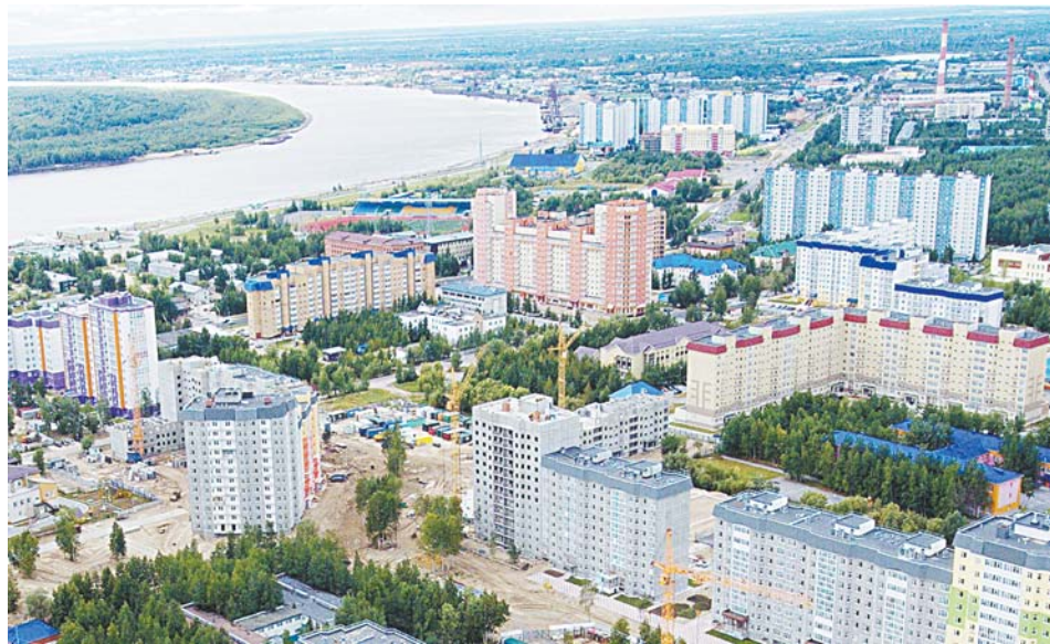
9А микрорайон меняется на глазах. Так он выглядел летом 2016 г.

Подобного консенсуса с общественниками может не оказаться в ходе другого обсуждения изменений территориальных планов застройки города. Когда номер газеты, который вы сейчас читаете, будет дан в печать, вечером 31 августа, пройдут ещё одни публичные слушания – по вопросу возможного строительства жилого дома в соседнем 9 микрорайоне на месте ранее запланированной автомобильной парковки. Эксперты отмечают, что там мнение чиновников и части жителей микрорайона может оказаться полярным. Некоторые гражданские активисты накануне уже разместили в социальных сетях призывы противостоять «точечной застройке» микрорайона. «СЭ» будет следить за развитием ситуации.