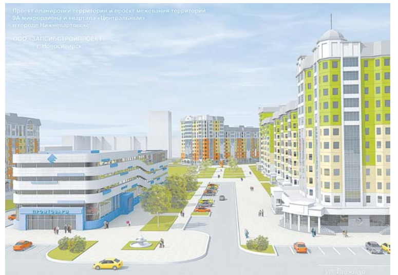
Вот так будет выглядеть бульвар Рябиновый. Он берет свое начало от ул. Омской.