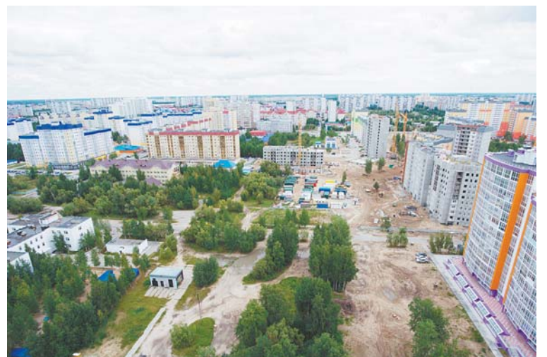
Вид на строящийся бульвар Рябиновый со стороны ул. 60 лет Октября пока малопривлекательный. Но уже в следующем году строители планируют приступить к работам по благоустройству. А первым жилым домам здесь уже присвоен адрес «бульвар Рябиновый».

низм, который требует изменений согласно времени. И сейчас мы переживаем один из пиков интенсивного развития городской среды.