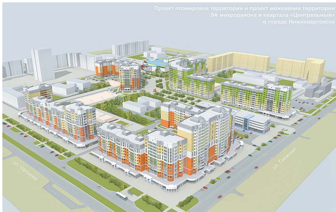
Проект планировки территории и проект межевания территории 9А микрорайона и квартала «Центральный» в городе Нижневартовске

Нижневартовска. Он станет пешеходным, вдоль встроенных нежилых помещений и многоэтажных домов будут размещены парковки. Сквозных проездов там не будет. Появятся тротуары, газоны, озеленение, элементы монументально-декоративного оформления. С эстетической точки зрения мы постараемся сделать так, чтобы бульвар стал красивым и удобным для горожан, чтобы здесь было комфортно жить и приятно прогуливаться. Эскиз