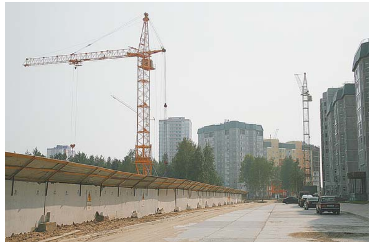
Уже сейчас здесь угадываются очертания будущего бульвара. Слева за строительным забором началось возведение многоуровневого паркинга на 300 мест.