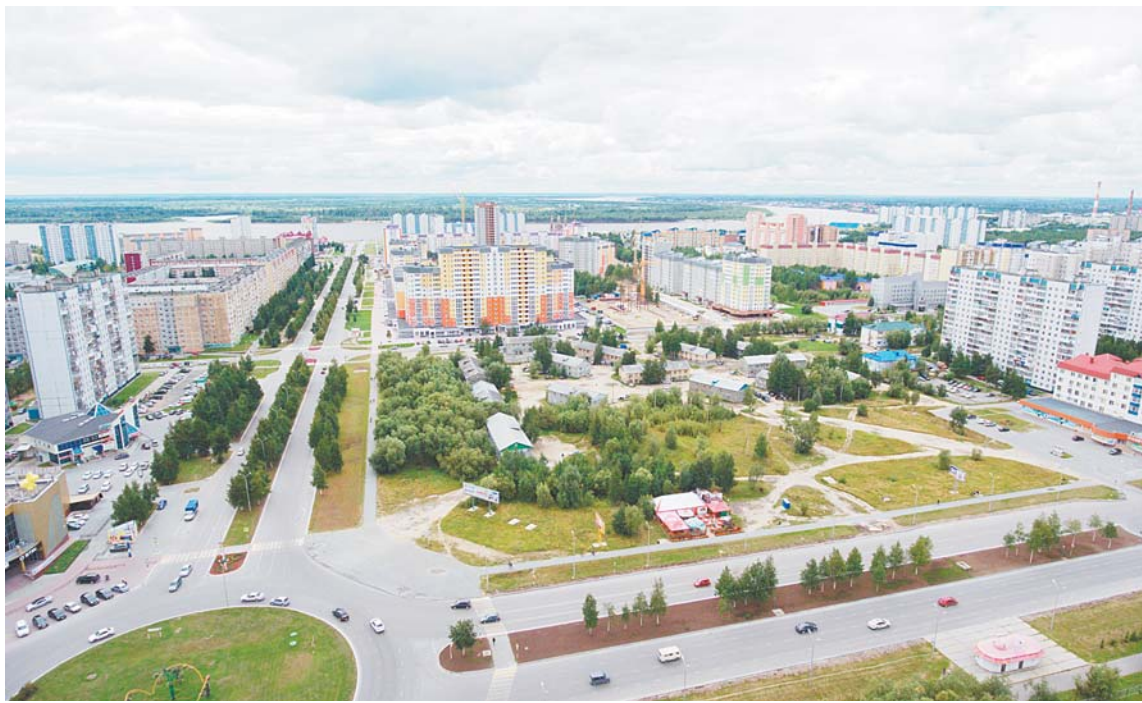
Пока здесь все по-старому. Но в скором будущем вот на этом самом месте планируют разбить сквер и построить Дворец бракосочетания. Нашему городу не хватает зеленых зон отдыха, прогулочных мест, которые бы могли стать отдушиной для нижевартовцев, говорят специалисты.

Облик Нижневартовска формируется у нас на глазах.