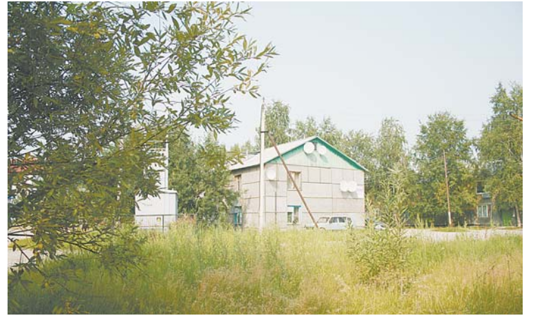
Придет время и ветхие двухэтажки в этой части города, наконец, снесут. Есть желающие застроить эту территорию, но по генплану она уже закреплена для рекреационной зоны.

Нижневартовск развивается циклично – когда-то, в начале 90-х годов, мы планировали уйти в сторону острова Чехломей, но затем развитие приостановилось на несколько лет. Генплан – это живой орга-