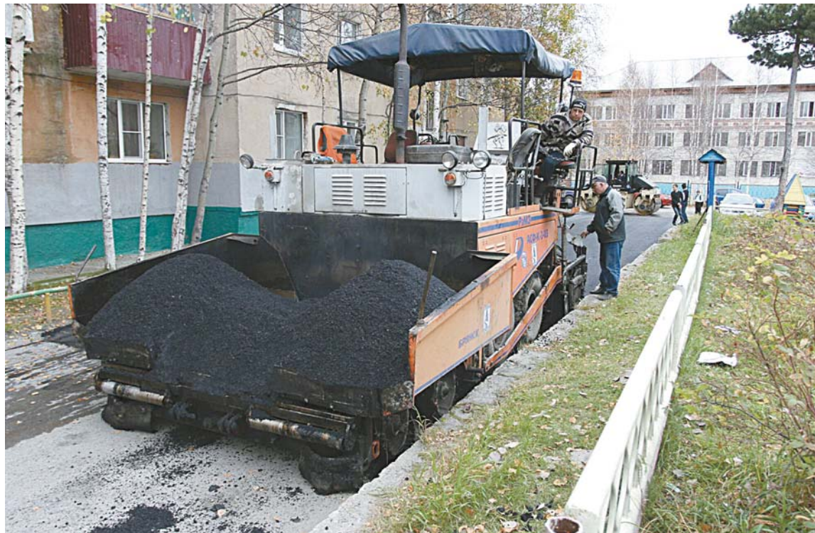
На благоустройство территорий многоквартирных домов в 7 и 7а микрорайонах из окружного и городского бюджета было направлено 6 млн. 170 тыс. 760 руб.

врожденные патологии плода и улучшить качество оказания реабилитационной помощи;