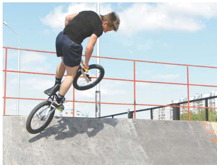
Роллердром в районе стадиона «Центральный».