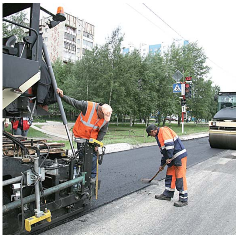
На содержание и ремонт автомобильных дорог только в 2013-2015 гг. направлено 1 млрд 871 млн 500 тыс. руб.