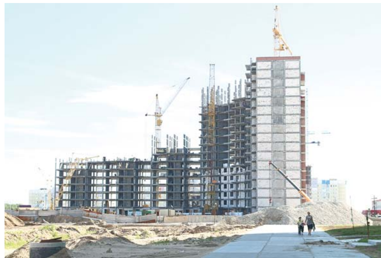
За 2012-2015 годы построено 574,9 тыс. кв. м жилья или 9057 квартир.

Отчет депутата перед избирателями – это не только закрепленная законом обязанность, но и возможность, проинформировав вас о своей работе, получить новые обращения и предложения по дальнейшей деятельности. Я очень надеюсь на ваше внимание, поддержку и советы о том, как нам и дальше вместе работать над тем, чтобы сделать жизнь в Нижневартовске еще более комфортной, благополучной и имеющей четкие, благоприятные перспективы.