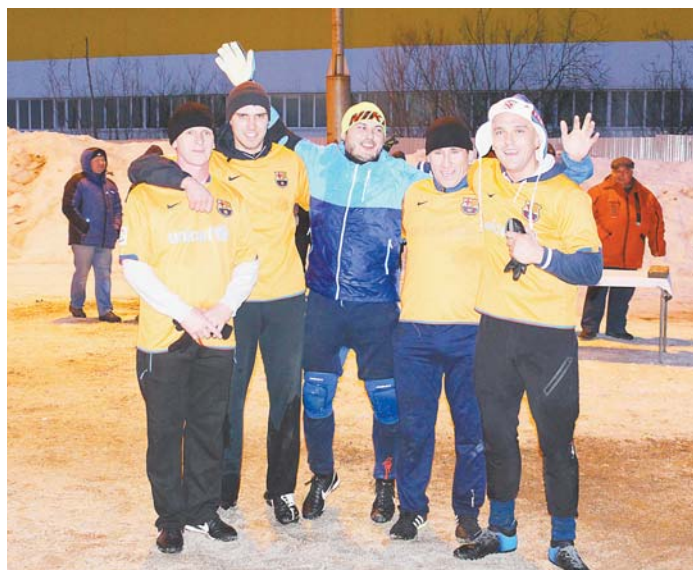
Турнирная таблица XVIII чемпионата АО «Горэлектросеть» по мини-футболу-2017

Ежегодные турниры по мини-футболу стали одной из самых устойчивых традиций в спортивно-массовой жизни предприятия. Каждое соревнование превращается в праздник, сплачивает коллектив.