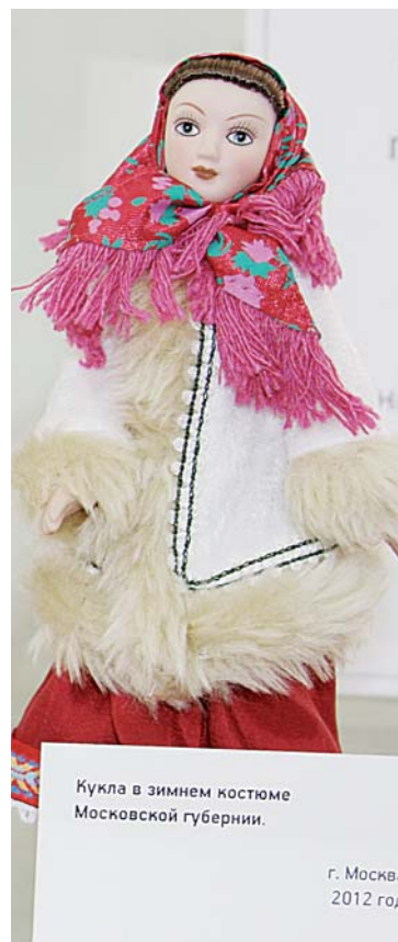
Кукла в зимнем костюме Московской губернии.