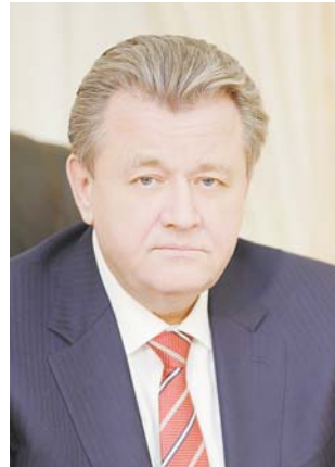
Глава города Нижневартовска Василий ТИХОНОВ

От всей души поздравляем вас с юбилеем нашего города! 45-летие Нижневартовска – это повод оглянуться назад и в то же время открыть новую яркую страницу в его славной истории.