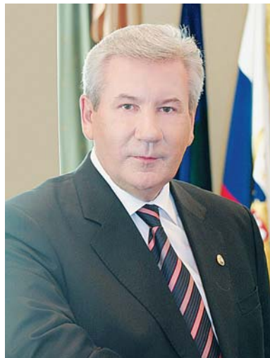
Председатель Думы Ханты-Мансийского автономного округа – Югры Борис ХОХРЯКОВ